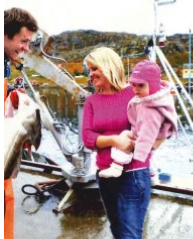
Tiden i Finnmark ga meg et helt ordan livet bør og skal være, sier