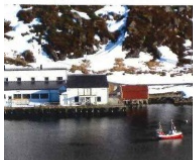
Det av fiskebruket i Finnmark g som en spøk.