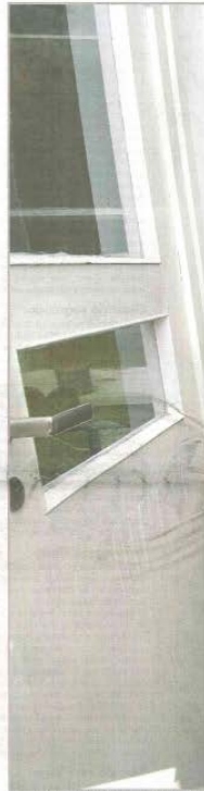
GODT HUS: – Beste rommet i huset mitt. Takks an.

– Ein ting er å selja hus, men det er ikkje enkelt å få bygga heller. Eg hadde sett meg ut ei solrik tomt i Krundalen, men det måtte eg skrinleggja. Vegvesen skal godkjenne nye avkjørsler, og eg fekk net. Det i ein kommune som skal leggja til rette for å skilja ut