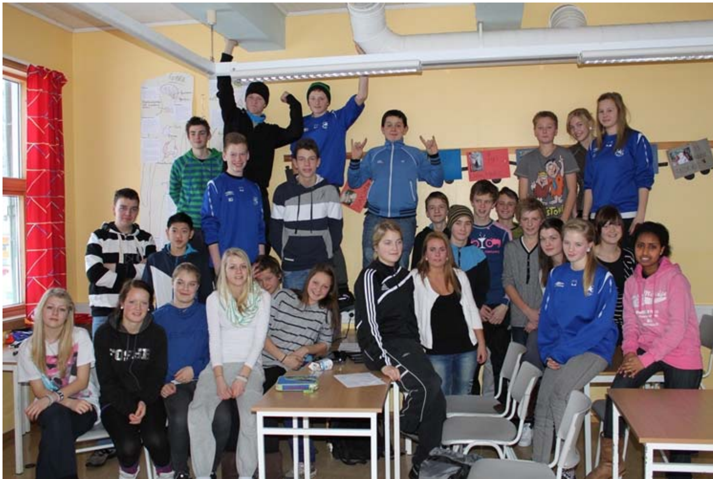
Gründercamp: Oppstart av elevbedrift Vik januar 2011