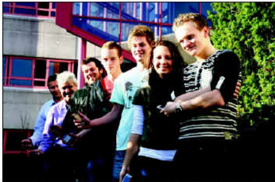
Lærte deltakerne å samarbeide med hverandre, og å finne ut av hva som er viktig for dem. De fikk også tips og råd om hvordan de kan starte opp et eget firma.