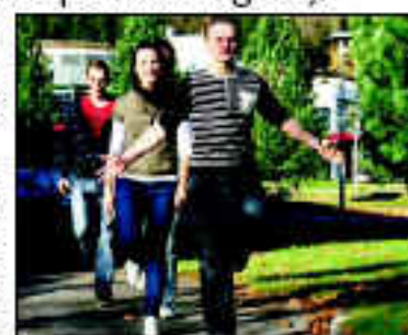
Dei vil gjere det på ein måte som er god for miljøet. Dei vil gjere det på ein måte som er god for miljøet.