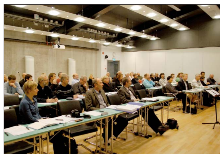
KONFERANSE: Regionsenterkonferansen set fokus på korleis Sogndal kan bli styrka som regionsenter på ein måte som også gagnar omlandet. Dei fleste deltakarane var politikarar frå dei sju regionrådskommunane.

– Me skal veraause med nabo-kommunane, vera sunnhordlendingar og stordabuer, ta til orde for strategiar for utvikling av vinn-vinn situasjonar, og tala regionen si sak i møte med Bergen og Stavanger, sa Sandtorv.